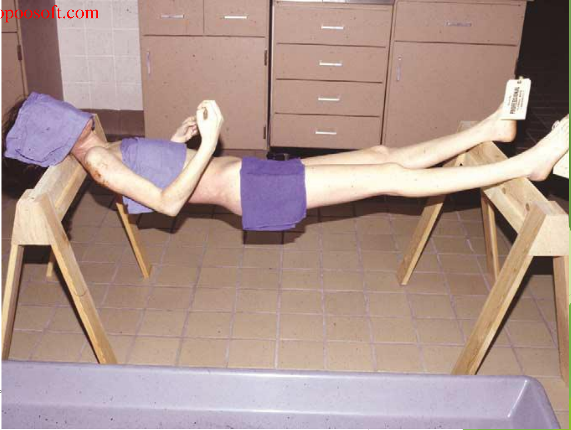
صدر گواهی فوت