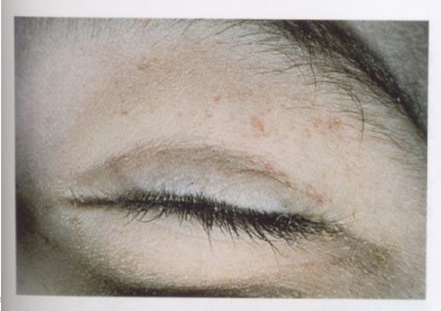
گ و صدر گواهی فوت