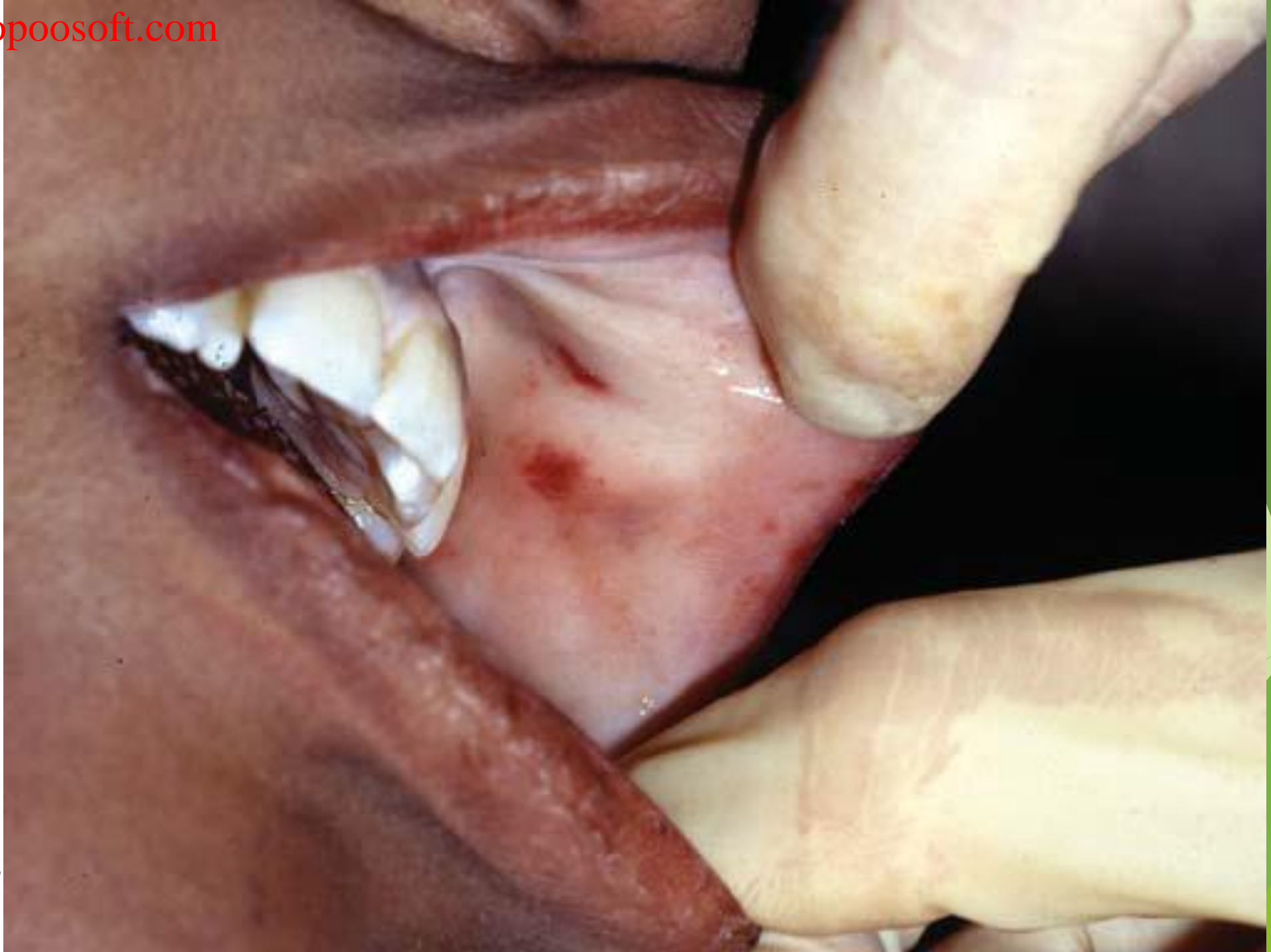
صدر گواهی فوت