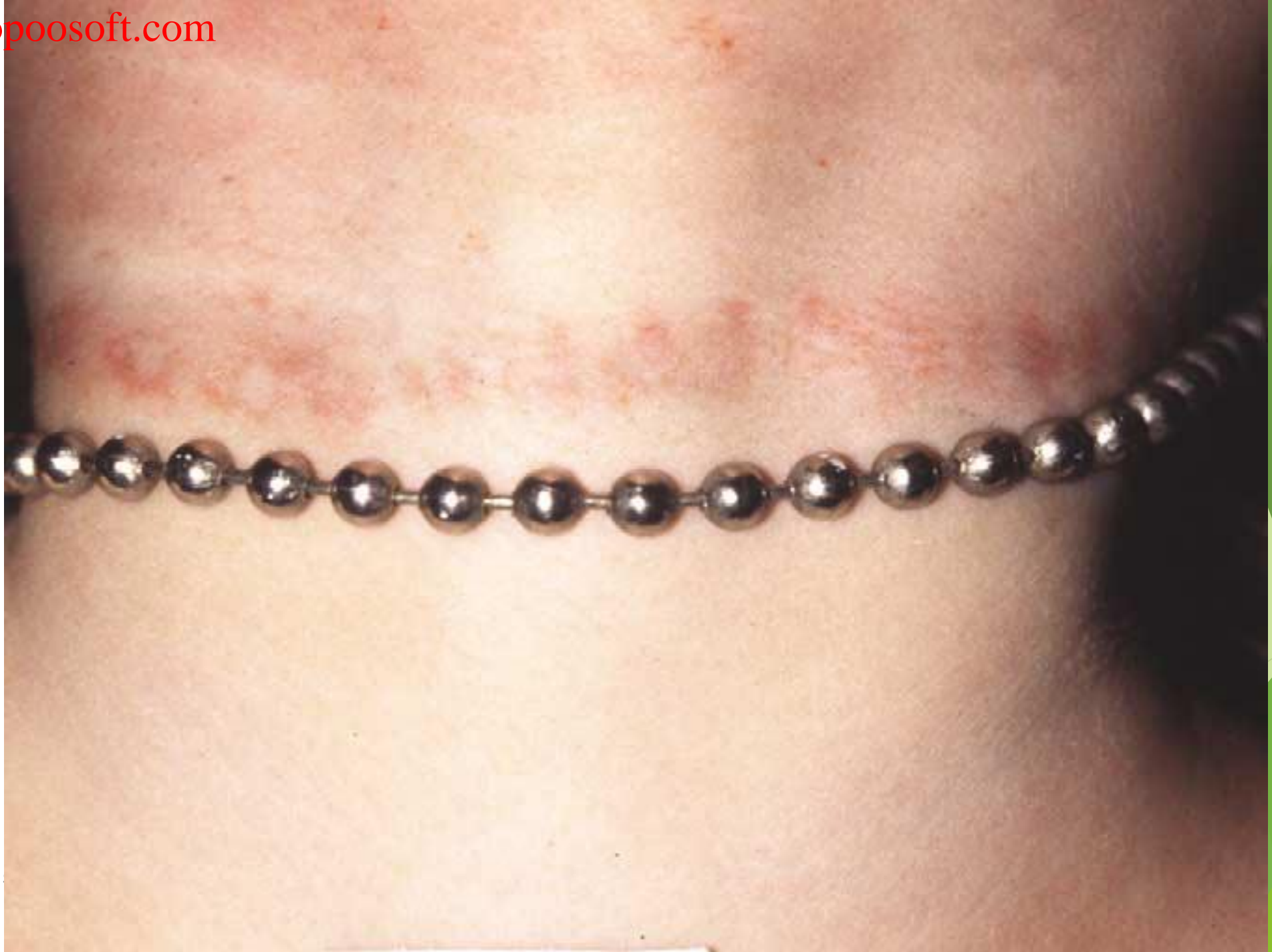
صدر گواهی فوت